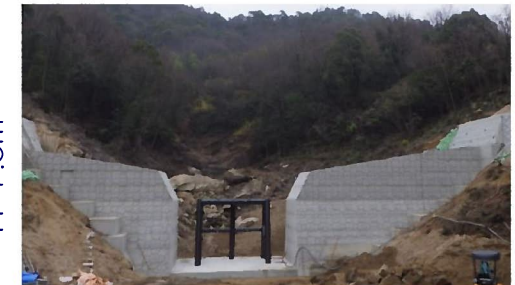
工事完了（令和3年3月17日）