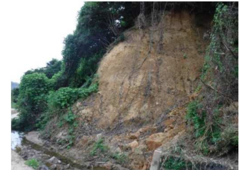
斜面崩壊・被災状況（H30年7月）