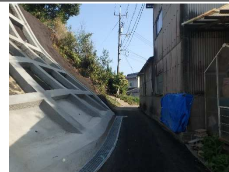
工事完了（令和3年3月15日）