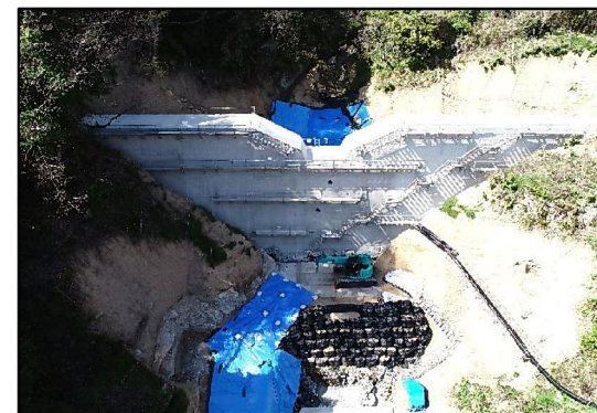
工事完了（令和3年3月25日）