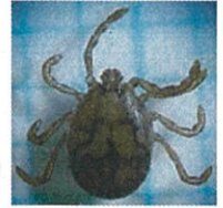
フタトゲチマダニ

気温の上昇とともにマダニの活動が活発になるため、この時期から、マダニが媒介する感染症への注意が必要です。畑仕事、草刈り、墓参りをされた方や60歳以上の方が多く感染しています。草むらや藪に入るときには、長袖、長ズボンの着用、忌避剤の使用等によりマダニに咬まれないよう注意しましょう。