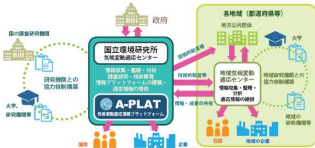
【気候変動適応センターの役割イメージ】