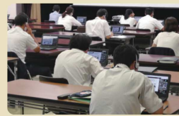
オンラインでツナがり伸び続ける