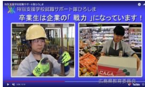
就職サポート隊ひろしまのCM