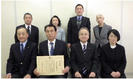
就職サポート隊ひろしま推進企業を表彰

企業の障害者雇用への理解啓発と生徒の就職支援のため、引き続き周知を図る必要がある。