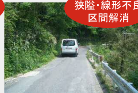
(国) 433号 豊平バイパス