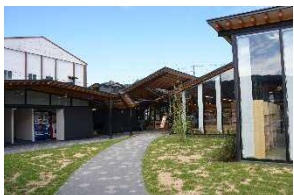
道の駅「びんご府中」