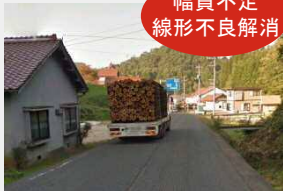
(国) 191号 (松原)