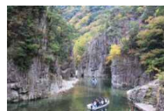
国の特別名勝 三段峡