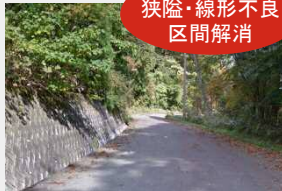
(一) 恐羅漢公園線 (那須)