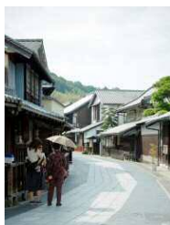
たけはら町並み保存地区