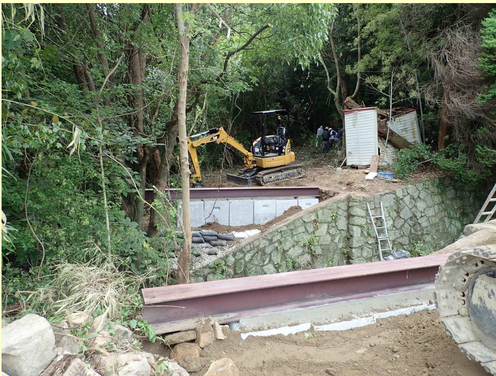
工所用道路工 (R2.6月末時点)