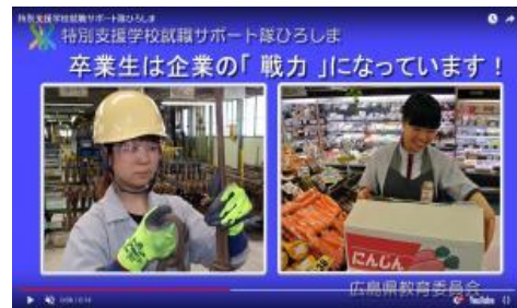
就職サポート隊ひろしまのCM