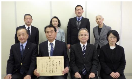
就職サポート隊ひろしま推進企業の表彰

就職者のうち、登録企業に就職した者の割合は、令和2年度は47.6%であり、半数近くの就職者が登録企業に就職している。（【表2】）