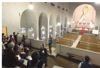
世界平和記念講堂