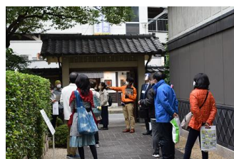
頼山陽史跡資料館