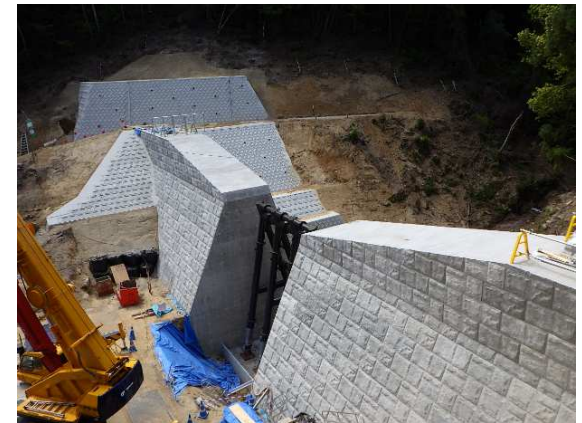
工事状況（令和3年4月26日）