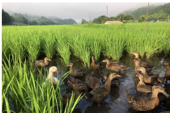
アイガモがたんぼで大活躍