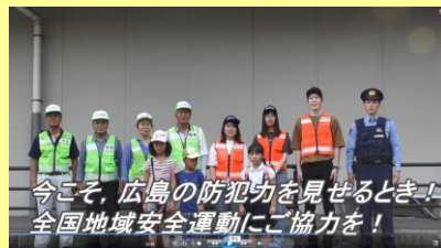
全国地域安全運動動画

YouTube「広島県警察公式チャンネル」で公開されています。皆さんもぜひ視聴してください。→