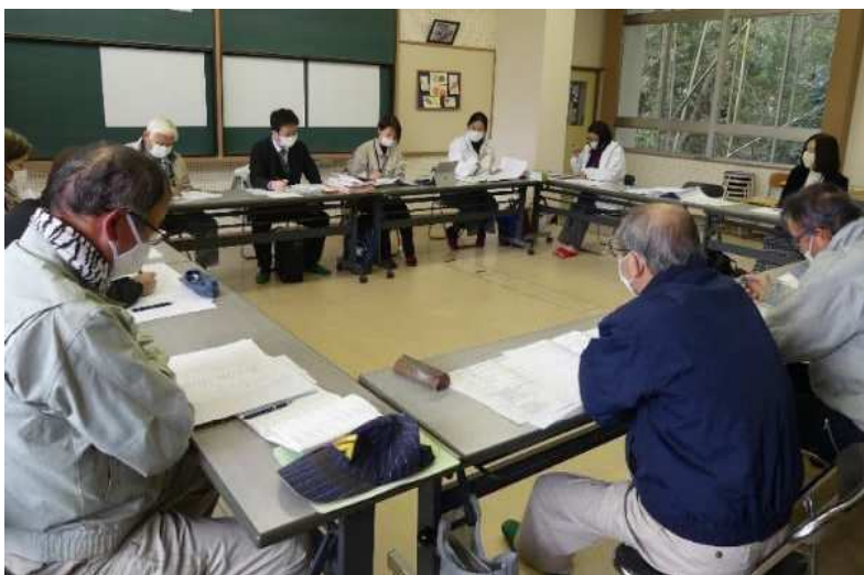
住民代表との地域課題の共有・協議の様子