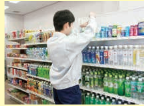
広島障害者職業能力開発校での訓練