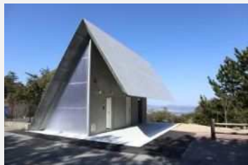
2018年 瀬戸内海国立公園高見山公園内トイレ

URL https://www.pref.hiroshima.lg.jp/site/miryoku/challe-com.html