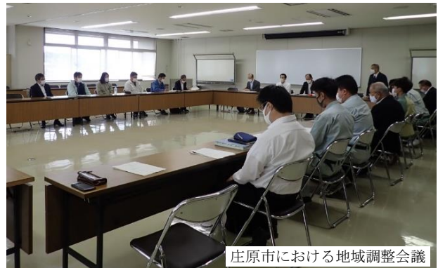
庄原市における地域調整会議

17市町において地域調整会議を開催するとともに、意向調査実施地区の森林資源情報等の提供や経営管理集積計画の策定支援等を実施した。(17市町が意向調査に着手)