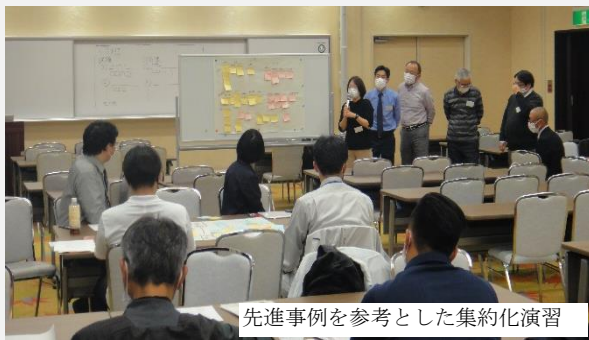
先進事例を参考とした集約化演習

・森林の集約化や森林経営管理制度の運用等について全国の先進事例をもとに、演習を実施した。(2日間、延べ53人参加)