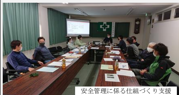
安全管理に係る仕組みづくり支援

安全管理に係る仕組みづくり等に向けて、労働安全衛生コンサルタントと協力し、安全診断や安全指導を行うとともに、現地検討会を実施した。