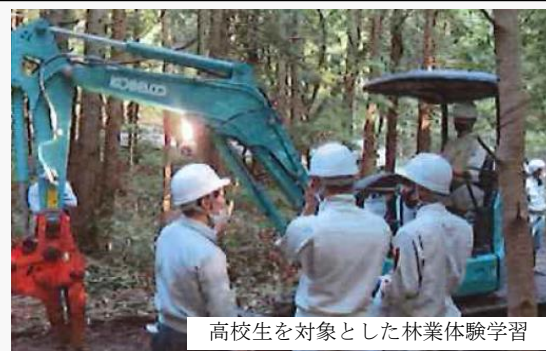
高校生を対象とした林業体験学習