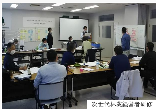
次世代林業経営者研修