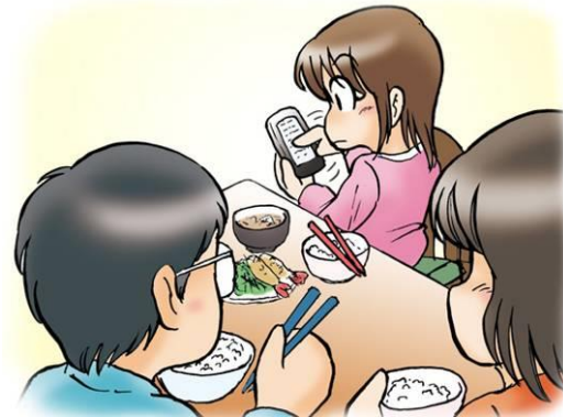
( ) 内は児童・生徒対象

そんなある日、両親が早く帰宅して、久しぶりに夕食を家族全員でとりました。みんなで食事をしている最中に、ハルカさんのスマホが鳴り響きます。食事もしこそこそに食卓でLINEの返信を打ち始めるハルカさん。それを見たお父さんとお母さんは…。