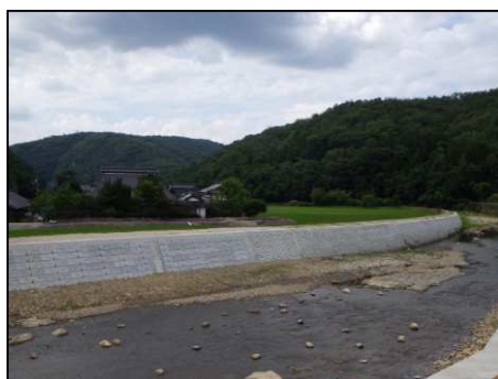
(一) 板木川 (三次市下志和地町)