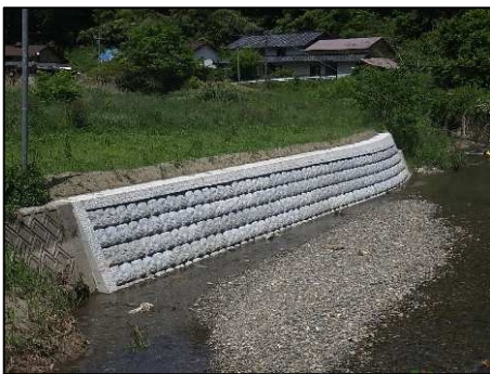
(一) 亀谷川 (庄原市総領町)