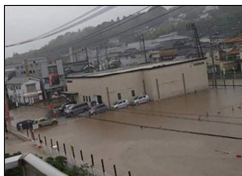
三津大川（東広島市安芸津町）