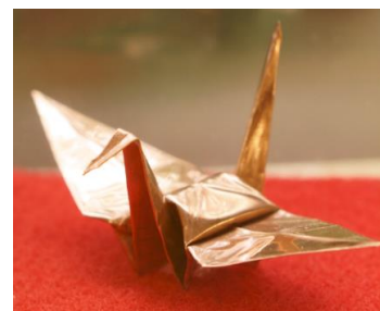
記念品『銅板折り鶴』