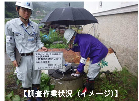
【調査作業状況（イメージ）】