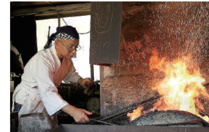
三上貞直刀匠

広島県無形文化財保持者である三上貞直刀匠は、全日本刀匠会会長、広島県刀職会会長として、長年にわたり日本刀の製作・普及に尽力されてきました。本展では、三上刀匠の40年余りに及ぶ足跡を、その豪壮にして繊細な作刀とともに紹介します。