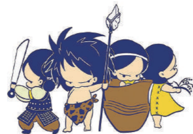
左から、鉄の妖精カタナ・石の妖精ヤリー・土の妖精ドキー・イネの妖精イナホ

三次市の「マツガサコ」の丘では、3万年以上にわたって人々が暮らし、石のヤリや落とし穴で動物を捕まえたり、王様のお墓を作ったりしました。どうしてこんなことが分かるのでしょうか？ この夏、マツガサコの歴史のナゾを解く展示会を開きます。ご家族で「ナゾとき3万年の旅」にお越しください。