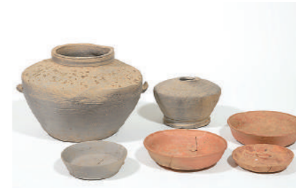
須恵器・土師器 陣開第3号古墳(三原市)出土 広島県立埋蔵文化財センター蔵

山陽自動車道建設に伴う県内最初の発掘調査が福山市で行われてからちょうど40年になるのを契機に、建設に伴う多くの遺跡の発掘調査成果とその意義を改めて紹介するとともに、現在の山陽自動車道の維持管理の取組も合わせて紹介し、沿線の過去と現在の姿を考えます。