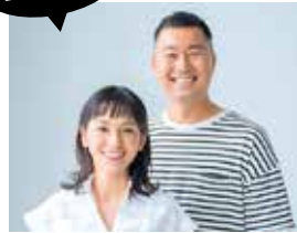
中島尚樹氏・井上恵津子氏 (フリーアナウンサー)