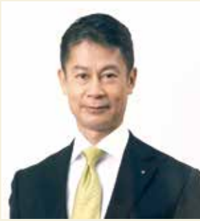
広島県知事 湯崎英彦

広島県の中山間地域は、豊かな自然環境に恵まれた中国山地や瀬戸内海を背景に、四季を通じて楽しめるアクティビティや歴史を感じさせる街並み、個性豊かで多様な文化など、里山・里海ならではの資産を有しています。コロナ禍においてこれまでの生活が見直されつつある中、地域に変化を生み出そうとする《人の輪》をさらに大きくして、地域の魅力や豊かさを、将来にわたってかけがえのない資産として大切に引き継いでいくための活動を共有していきたいと考えています。広島県では、こうした思いを込めて、オンラインによる「ひろしま さとやま未来博 2021」を開催します。