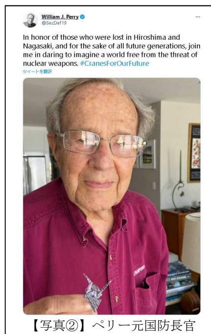
【写真②】ペリー元国防長官