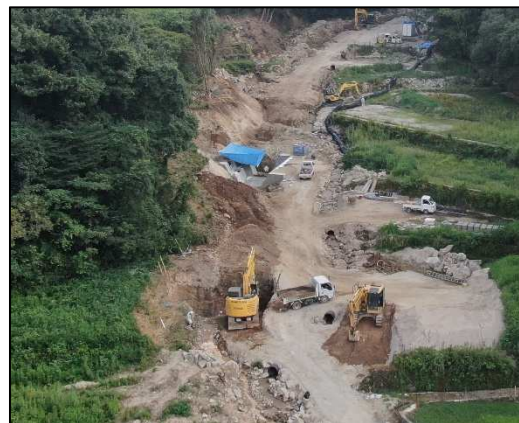
ひよき川（広島市安芸区）