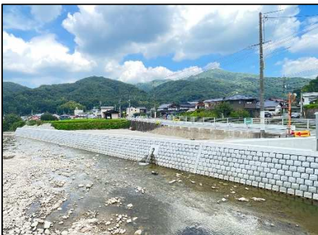
(二) 熊野川（広島市安芸区）