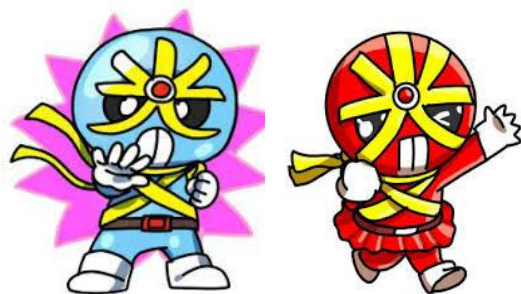
反射材活用促進キャラクター（広島県警）