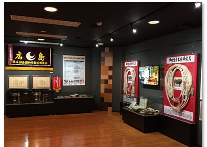
資料は、大正天皇大葬儀の牛装具や当時の貴重な映像、全共天皇杯、広島牛改良の沿革、岩倉蔓に関する書籍など庄原市、JA庄原、神石高原町などの協力を得て展示されています。