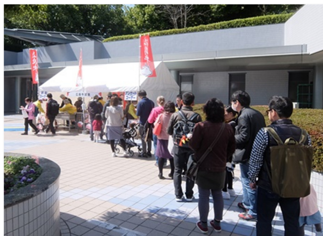
試食開始と同時に長蛇の列です。

当日は、 広島牛等に関するアンケート 回答者に広島牛無料試食を楽しんでいただきました。準備した 400 食はあっという間になくなり、「和牛」×「無料」＝最強の集客力“という方程式はここでも実証されました。