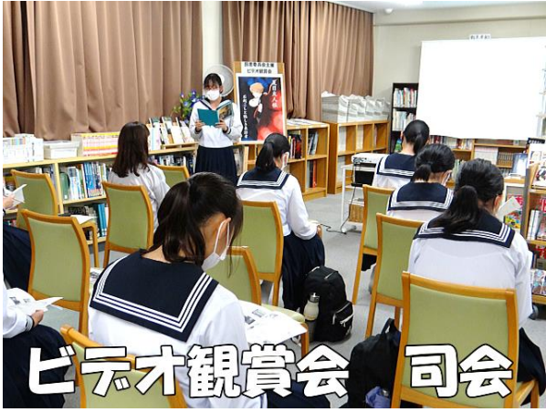
ビデオ観賞会 司会