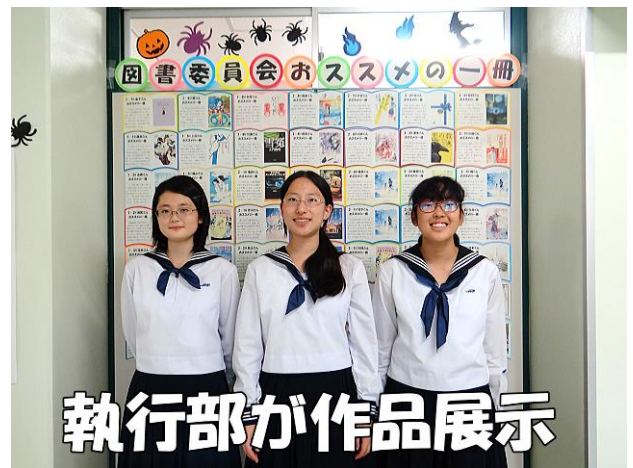
執行部が作品展示