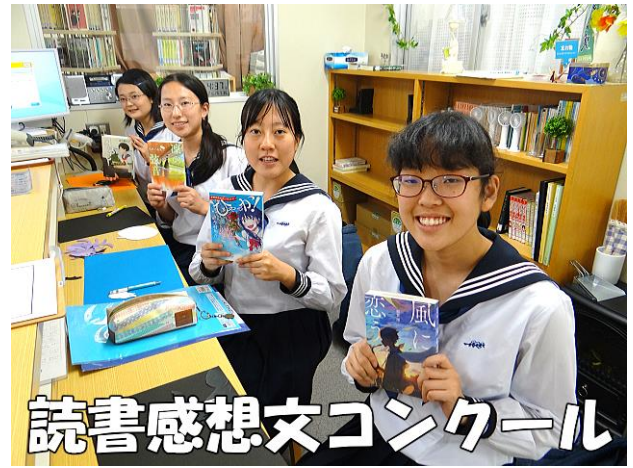
読書感想文コンクール