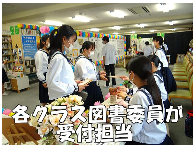
各クラス図書委員が 受付担当