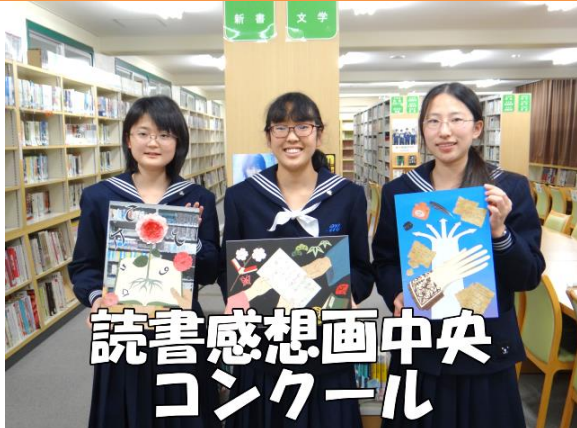
読書感想画中央 コンクール