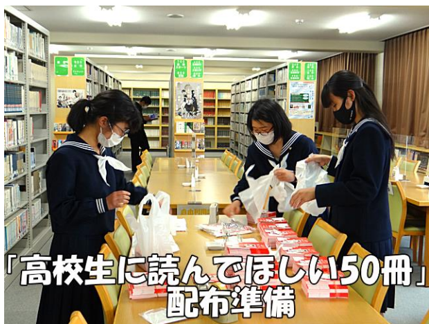
「高校生に読んでほしい50冊」 配布準備