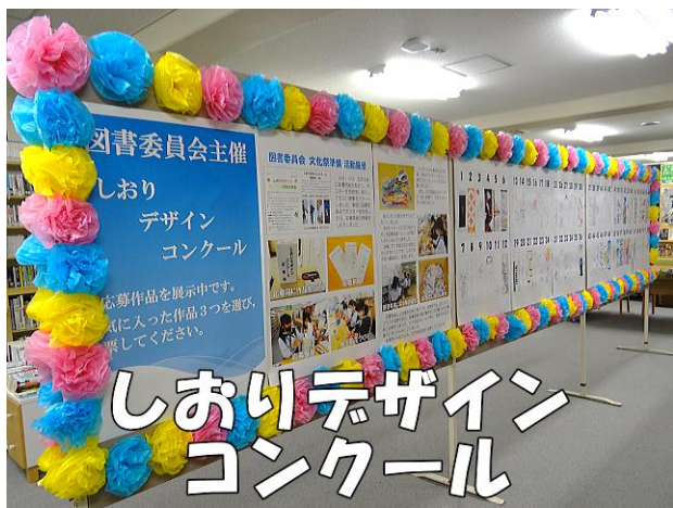
しおりデザイン コンクール