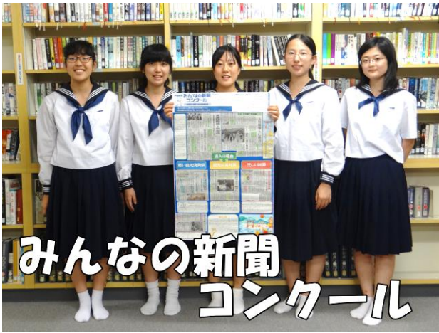
みんなの新聞 コンクール