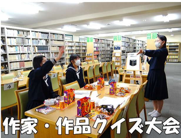
作家・作品クイズ大会