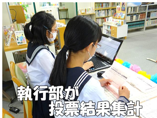
執行部が 投票結果集計