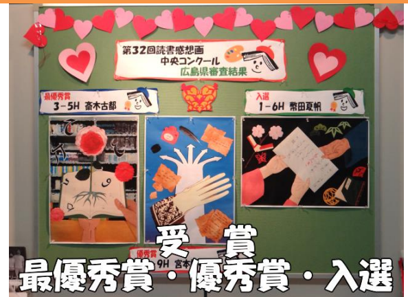
受賞 最優秀賞・優秀賞・入選