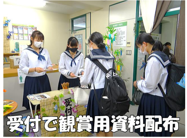
受付で観賞用資料配布