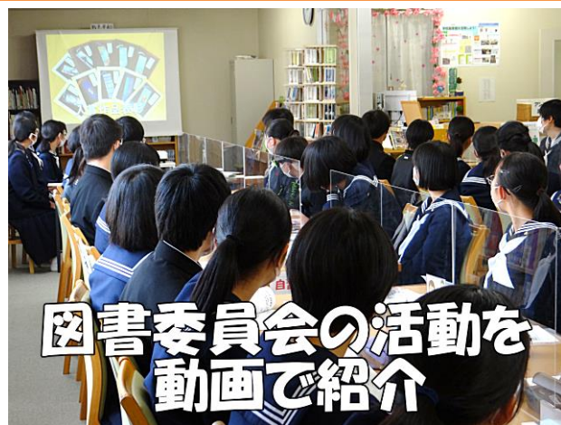
図書委員会の活動を 動画で紹介