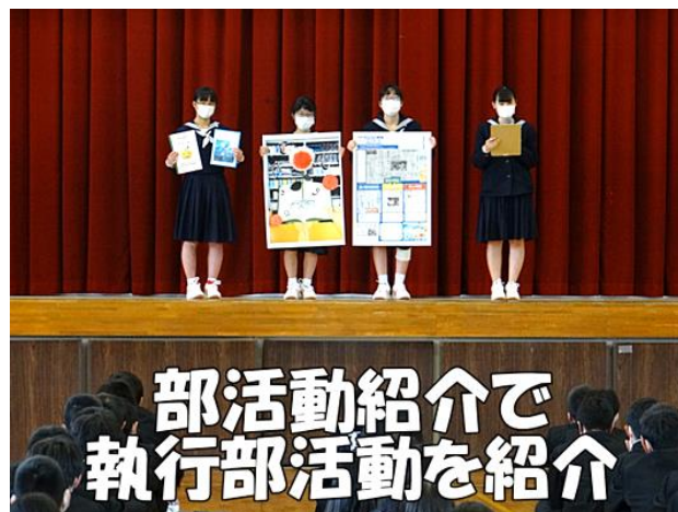
部活動紹介で 執行部活動を紹介