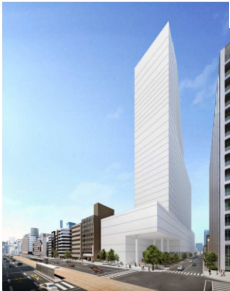
外観完成イメージパース