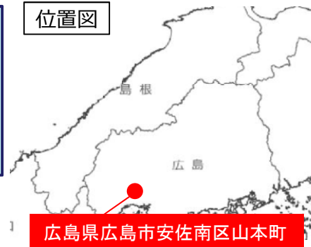
広島県広島市安佐南区山本町