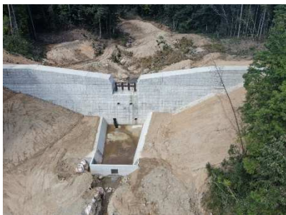
県：砂防激甚災害対策特別緊急事業 本頭川隣 (東広島市西条町)