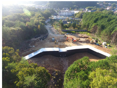
県：災害関連緊急治山事業 初神山地区 (熊野町初神山)