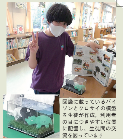
図鑑に載っているバイロンとクロサイの模型を生徒が作成。利用者の目につきやすい位置に配置し、生徒間の交流を図っています

今年度は新たに、県立図書館の電子図書貸出サービスを利用したり、キャリア教育(生き方・働き方)コーナーを設置したりしました。