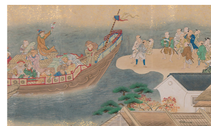
長崎図(部分、守屋壽コレクション、広島県立歴史博物館蔵)

日本最大級の古地図コレクション「守屋壽コレクション」の4回目の企画展で、昨年10月に当館へ寄贈されたことを記念して開催します。近世の人々が憧れた3都市、「千年の都 京」、「百万人都市 江戸」、そして「異国情緒の町 長崎」に焦点を当て、各都市の魅力に迫ります。