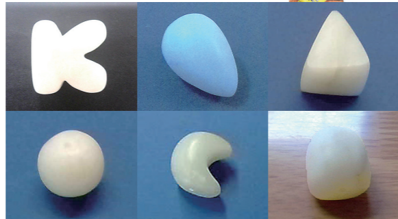
子供たちが作った「イノリノカタチ」

子供たちが楽しみながら学び、社会と人とつながるためのスキルを磨くことを目的とし、不登校SSR推進校等の子供たちをオンラインでつないで、体験的・探究的なプログラムを実施しています。