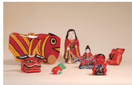
疳瘡(ほうそう)除けの赤物(あかももの) 福山市松永はぎもの資料館蔵

今も昔も子は宝。しかし、江戸時代は幼いうちに命を落とすことが多い時代でした。子どもの無事な成長は、人々にとって切実な願いであり、子どもに贈られる玩具や生育儀礼には、大人たちの祈りが込められていました。本展では、古文書や民俗資料などから、江戸時代を生きた子どもの実像に迫ります。