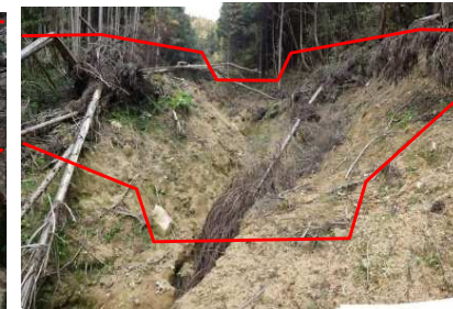
No. 2 谷止工