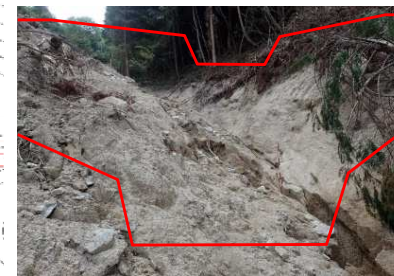
No. 1 谷止工