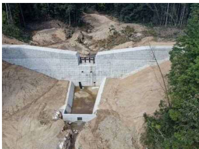
県：砂防激甚災害対策特別緊急事業 本頭川隣 (東広島市西条町)