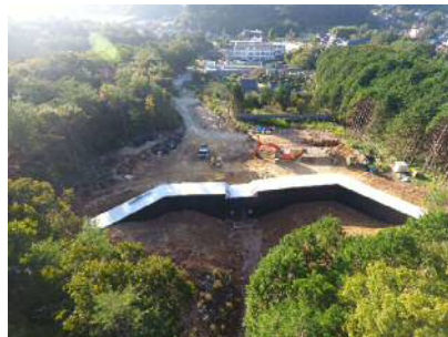
県：災害関連緊急治山事業 初神山地区 (熊野町初神山)