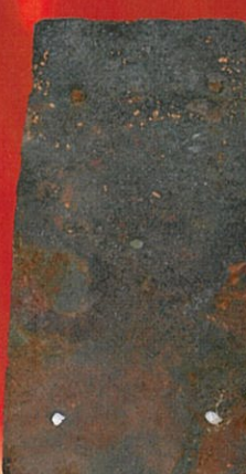
福山城の鉄板 福山市蔵