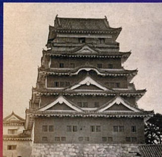
福山城天守北側の古写真 黒い鉄板張が見られる。