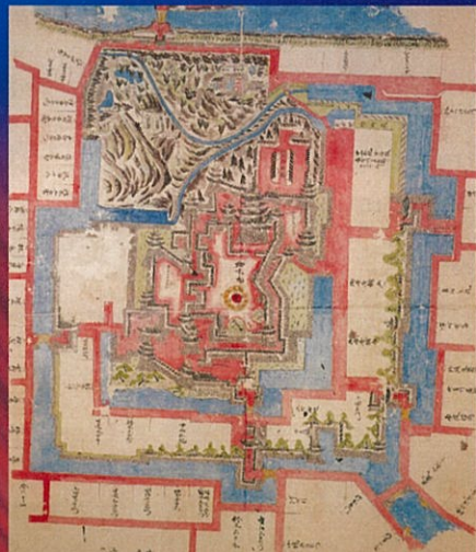
福山城古地図(福山市重文) 福山城博物館蔵 福山城と鞆は、水路で結ばれていた。

この登録を契機として、本展では知られざる鞆鍛冶の歴史を掘り起こし、港町とともに栄えた鞆鍛冶の歴史を広く紹介するものです。