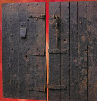
鉄盾(津山市重文) 徳守神社蔵 (津山郷土博物館寄託)