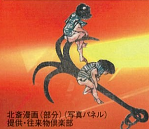
北斎漫画(部分)(写真パネル)

近代、鞆の船釘・錨は、全国の生産高を誇った。鞆鍛冶の資料は、全国的な産地として知られた船釘や錨などを製作する鍛冶用具が一式そろっており、鞆の鍛冶職人の技術を知ることができる。 また、鞆鍛冶の製品は、鞆錨の名で全国的に知られた錨のほか、各地で木造船の建造に使われた船釘が多数あって資料性が高い。