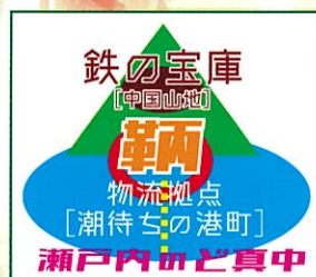
好条件の鞆鍛冶・イメージ図