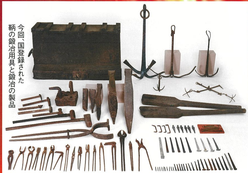
今回、国登録された 鞆の鍛冶用具と鍛冶の製品