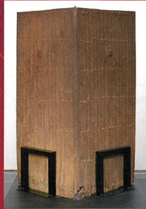
鉄盾(岡山市重文) 岡山市シテミュージアム蔵