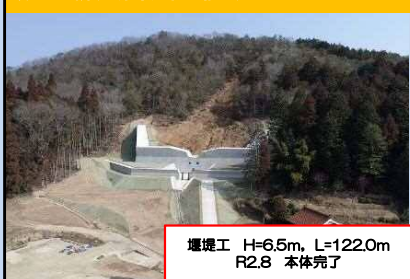
頭谷川2隣(三原市大和町福田)