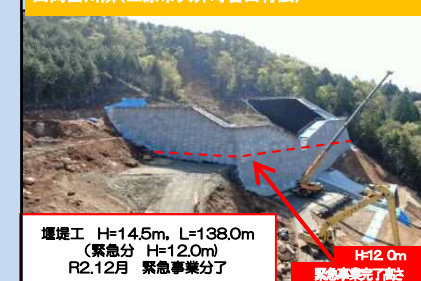
山岡西川隣(三原市久井町吉田行広)

堰堤工 H=14.5m, L=138.0m (緊急分 H=12.0m) R2.12月 緊急事業分完了