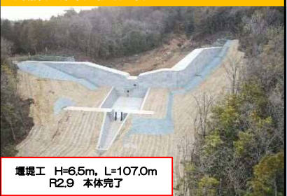
河頭隣(三原市大和町大草)