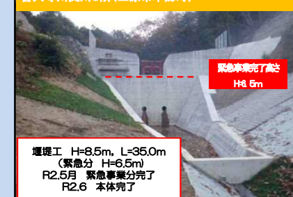
善入寺川支川3隣(三原市本郷町)

堰堤工 H=8.5m, L=35.0m (緊急分 H=6.5m) R2.5月 緊急事業分完了 R2.6 本体完了