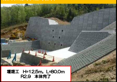
東川(三原市大和町和木)