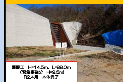
西福地川(三原市本原6丁目)

堰堤工 H=14.5m, L=88.0m (緊急事業分 H=9.5m) R2.4月 本体完了