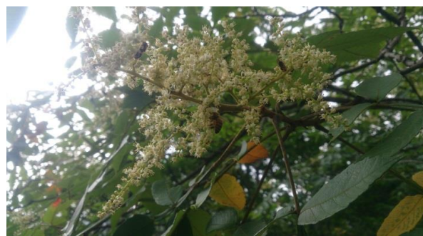
ミツバチが訪花している様子(ヌルデの花/9月)