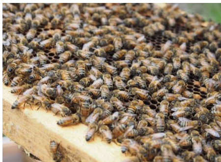
活気あふれるミツバチ