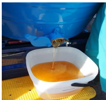
収穫したはちみつ(写真は5月上旬)