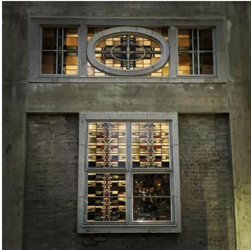
世界平和記念聖堂 (ユーザー名: mietsu0704 さん)

講評: 内部から撮りたくなるものを、外部から撮影したことで、薄暮の中、内部の光を受けてステンドグラスが鉄筋コンクリート造の躯体とタイルからじんわりと浮き上がる感じの表現が秀逸。