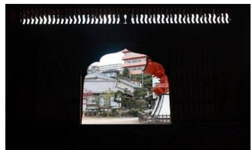
不動院 (ユーザー名: menkatakotteri_yasaimas imasi さん)