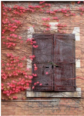
旧陸軍被覆支廠倉庫 (ユーザー名: nao.4320 さん)