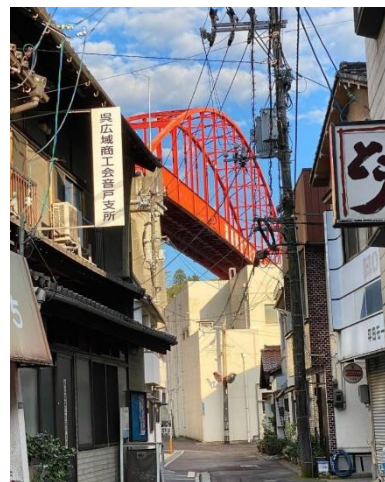
音戸のまち (ユーザー名: ichirou.ooki さん)