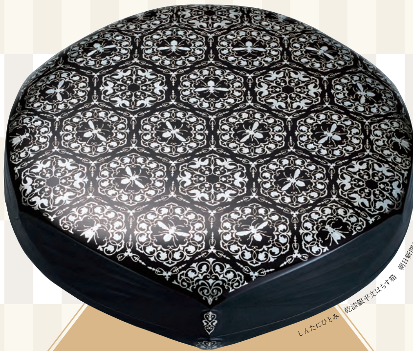
しんたにひとみ 乾漆銀平文はちす箱 朝日新聞社賞