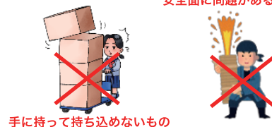
手に持って持ち込めないもの