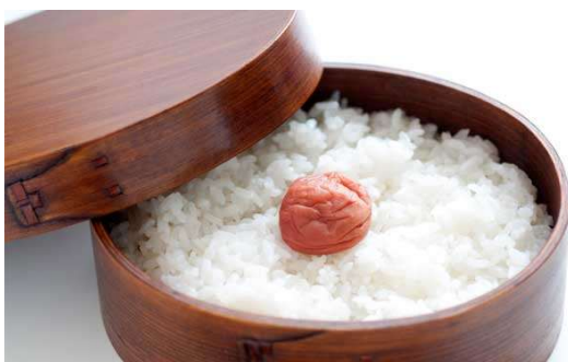
ご提案するメニュー お弁当