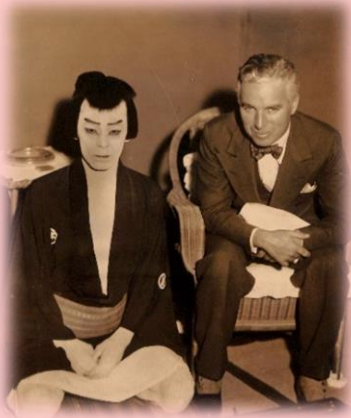
来日したチャップリン(右)と初代中村 吉右衛門(左) 1932年 (201622-10-9)