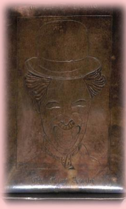
チャップリンの似顔絵が刻印 された蓋つき小物入れ (201622-39-3)