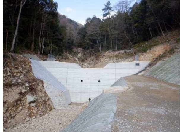
県：治山激甚災害対策特別緊急事業 エフリ谷地区 (呉市安浦町)