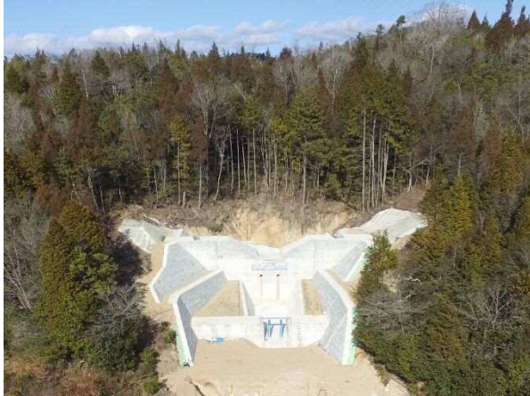
県：砂防激甚災害対策特別緊急事業 河頭隣2 (三原市大和町)