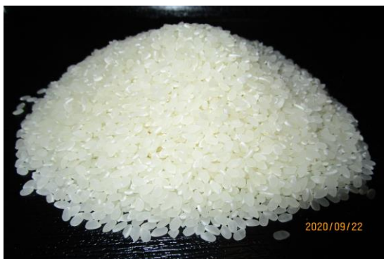
色彩選別、標準精米実施