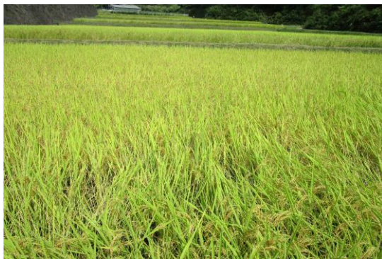
この圃場より上流には、住宅・宅地無し。