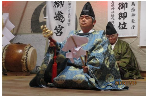
秋には命の奇跡に感謝する。