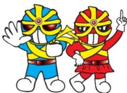
反射材活用促進キャラクター キラリ☆マンとキラリ☆ウーマン

この運動の実施結果を、 令和4年4月27日（水） までに広島県交通対策協議会交通安全対策部会事務局（交通安全対策室）へ提出すること。（報告様式については、別途送付する。）