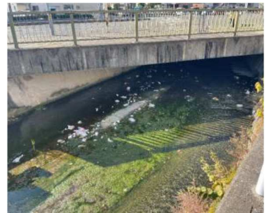
塚川 (呉市) 呉駅に向かう道路の橋の下