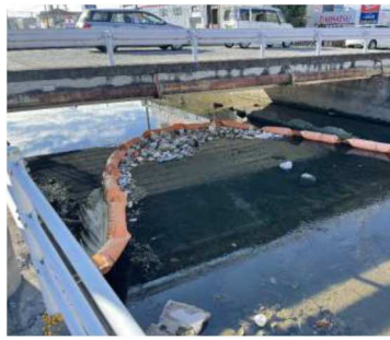
手城川 (福山市) 東福山駅周辺住宅地の網場