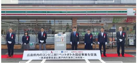
10/22 設置記念セレモニーの様子