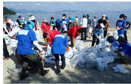
集めたごみの仕分け作業の様子