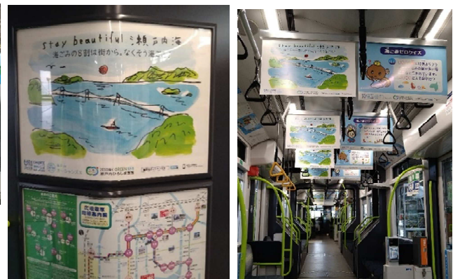
電車内の様子 (海ごみクイズポスター等を掲出)