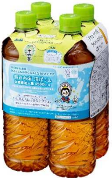
ラベルレスペットボトル