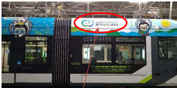
「瀬戸内ひろしま宣言」 ロゴ