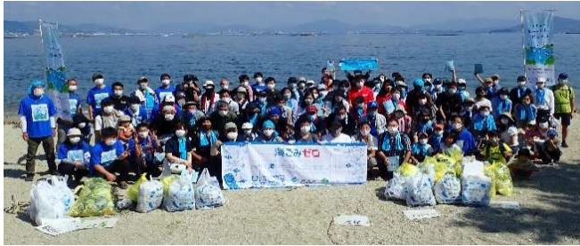
GSHIP 参画会員による宮島包ヶ浦自然公園の清掃活動 (10/9 実施時 集合写真)