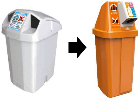
従来型のリサイクルボックス