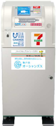
ペットボトル回収機